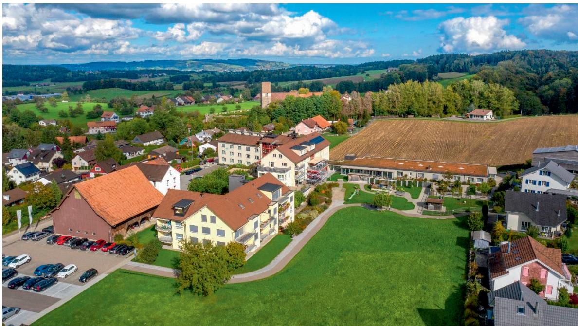
Bild Herbst 2020: Alterszentrum Sunnewies Tobel im Vordergrund und Pfarrkirche Sankt Johannes Tobel im Hintergrund