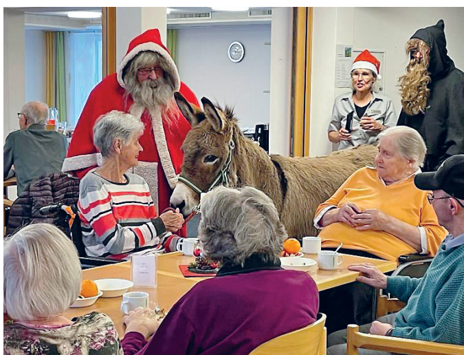
Chlausfeier im Dezember 2023