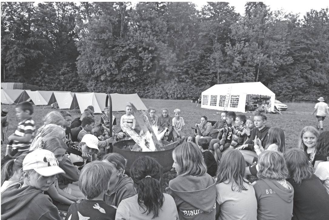
Jungwacht und Blauring Sommerlager 2023, Kinder beim Lagerfeuer