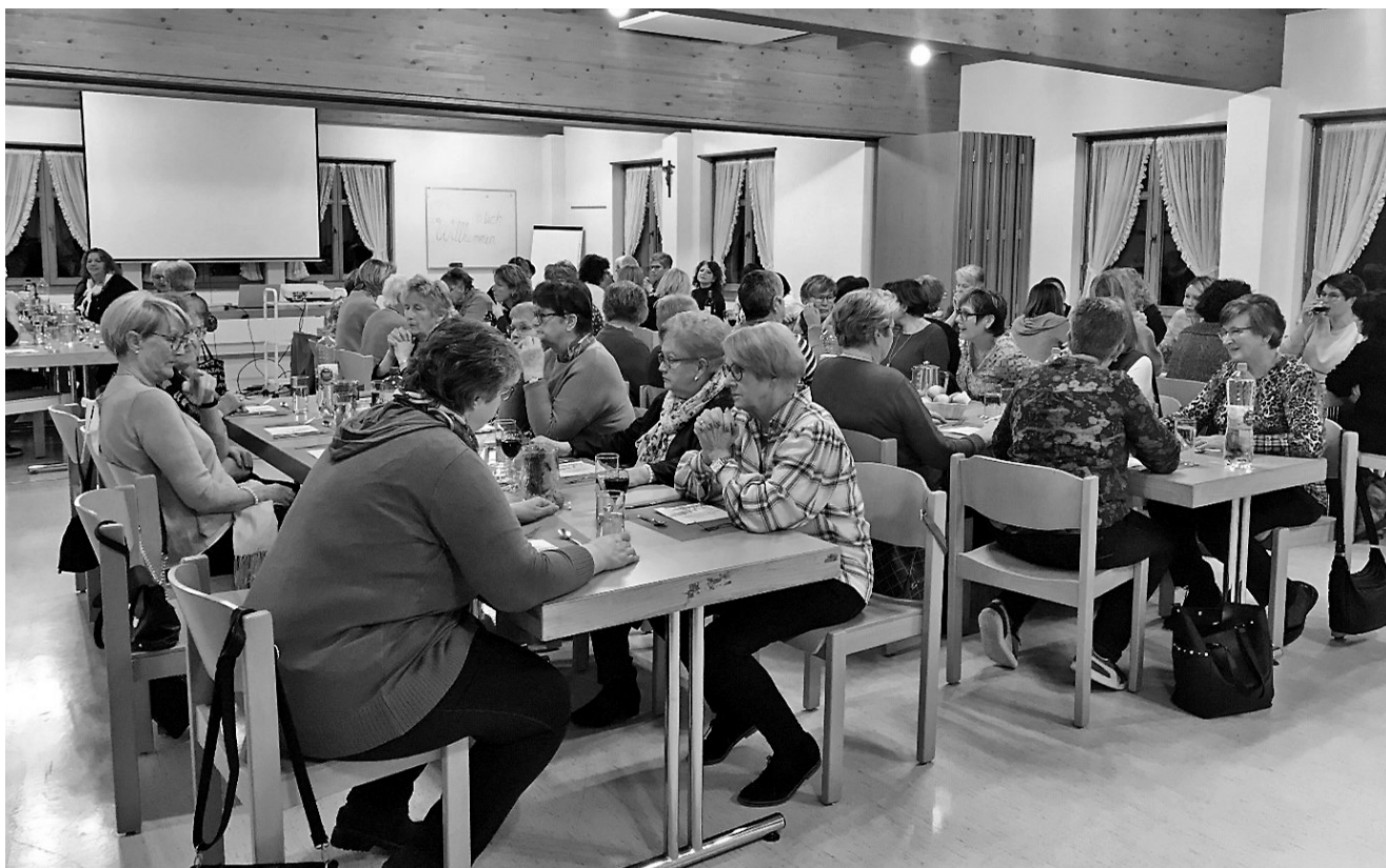
Frauengemeinschaft Tobel Jahresversammlung vom 20.01.2023 im Pfarreiheim