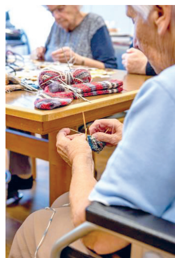
Bewohnerinnen beim Stricken