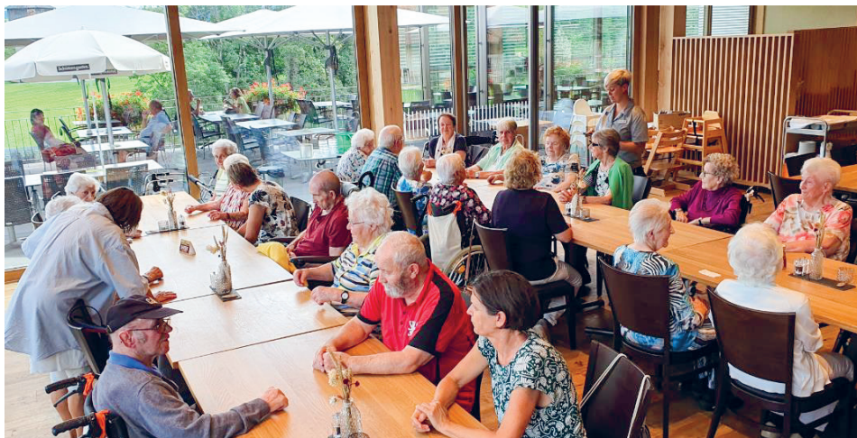
BewohnerInnen Ausflug nach Tufertschwil im September 2022