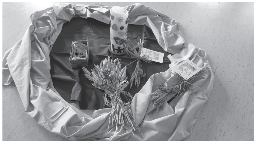
Kinderfeier Thema vom Korn zum Brot