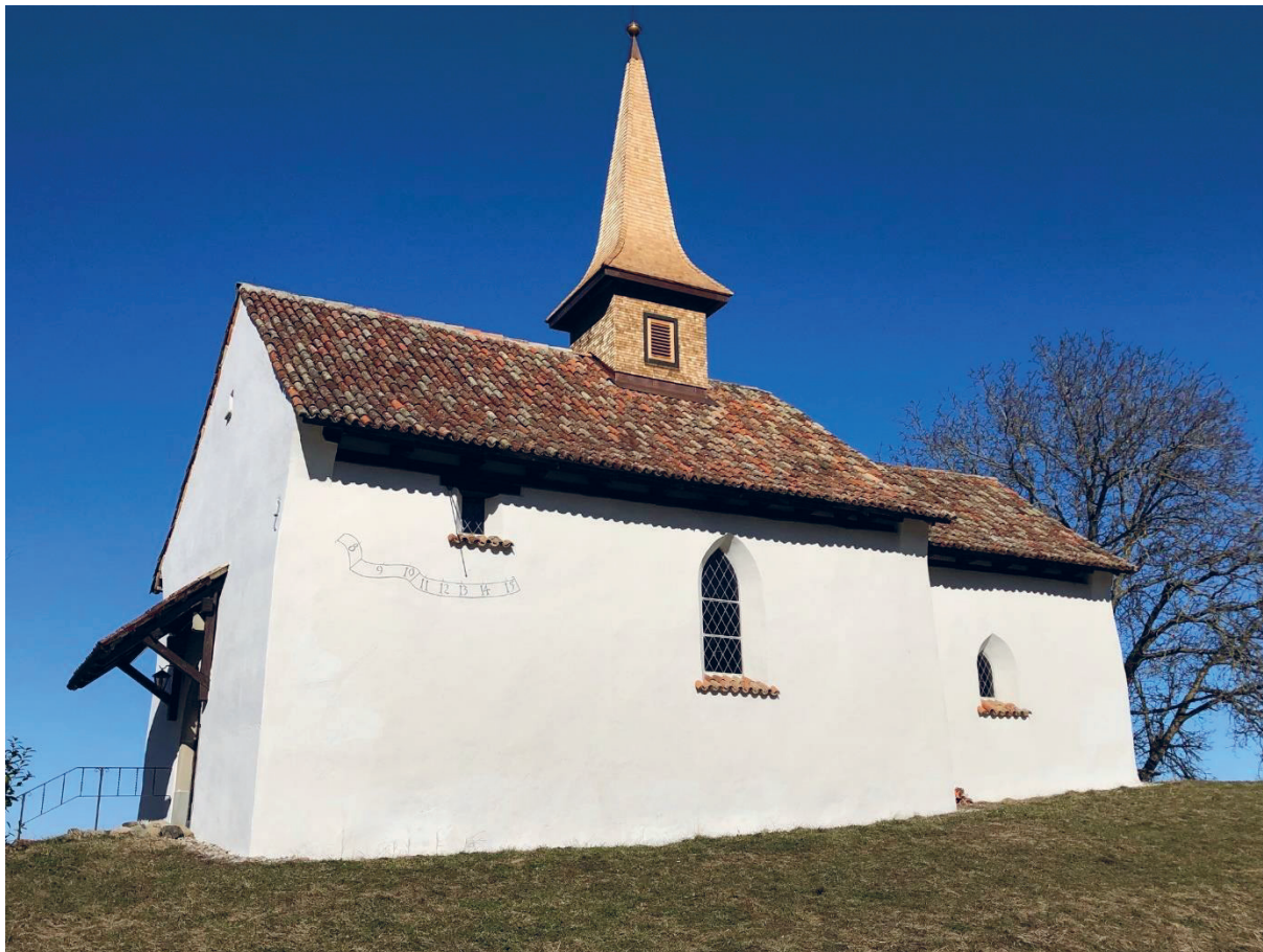
Kapelle Braunau mit renoviertem Türmli, Foto vom 15.02.2023